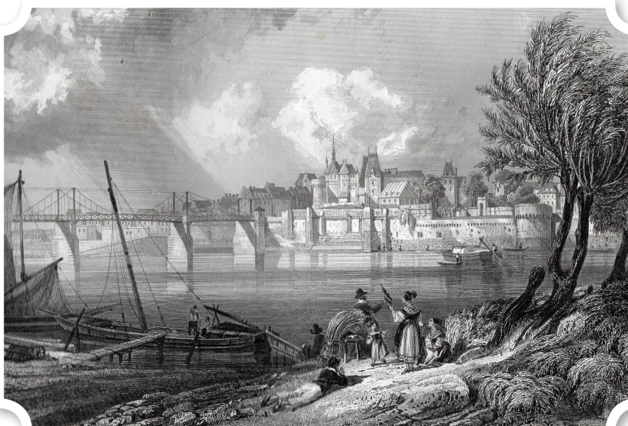
Une vue romantique du château d'Ancenis (gravure de Rouargue, vers 1840)

Au début du XVI e siècle, le château formait une grande enceinte polygonale. Bordée de larges douves en eau, cette enceinte était flanquée de tours dont des vestiges sont restés visibles jusqu'au milieu du XIX e siècle. Au sud-est, la Loire baignait ses murs. Ce château, aux fortifications conçues pour le canon, était l'aboutissement de siècles de transformations et de reconstructions. Le premier château remontait en effet à l'année 983 !