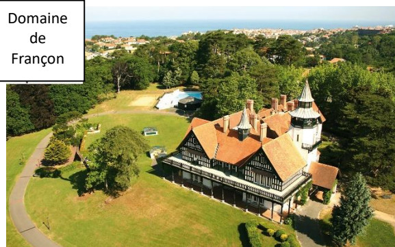
Domaine de Françon

Soirées : spectacle, soirée régionale, jeux, dansante, café-théâtre...selon programmation de la semaine wifi gratuite au bar et dans les chambres. Logement : en chambres ou appartements avec salle de bain et wc, télévision, situées dans le parc non attenantes au Manoir.